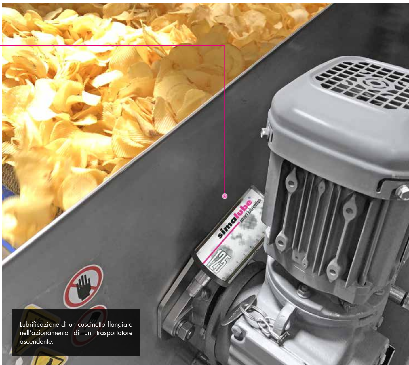
Lubrificazione di un cuscinetto flangiato nell'azionamento di un trasportatore ascendente.