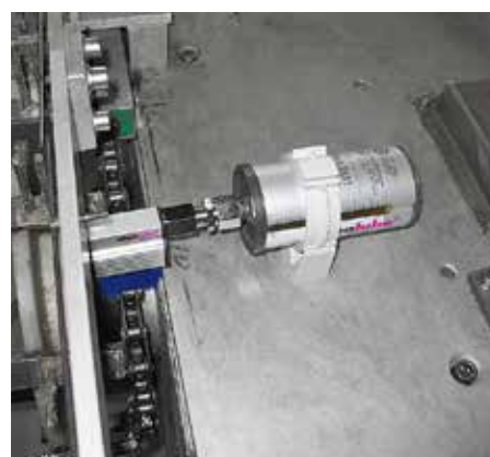
Nell'industria alimentare vengono utilizzate speciali spazzole con setole di colore blu, in quanto possono essere meglio individuate dai lettori ottici.