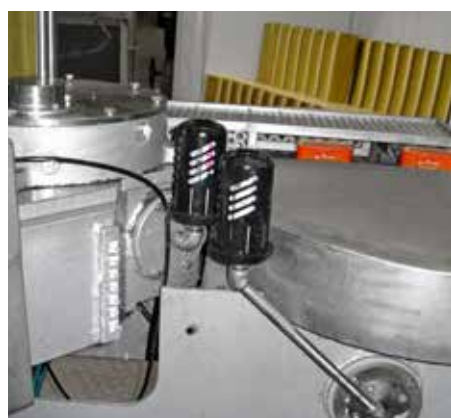
Lubrificazione di un tavolo rotante per unità di riempimento di cibo in scatola. I lubrificatori sono protetti da una calotta di protezione.