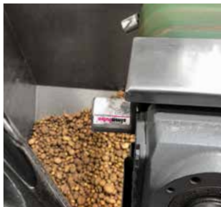
Due simalube da 60 ml lubrificano i cuscinetti del rullo deflettore di un nastro trasportatore nella lavorazione di patate.