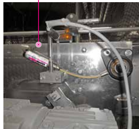
Lubrificazione di un cuscinetto flangiato con un simalube da 15 ml, il più piccolo lubrificatore al mondo.