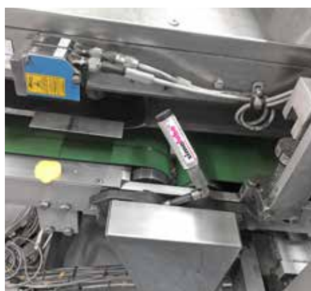
Lubrificazione di cuscinetti di un nastro trasportatore nella produzione di patatine.