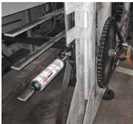
Lubrificazione catene con un simalube da 250 ml e spazzola piatta.

«I grassi alimentari dei lubrificatori simalube sono registrati NSF H1»